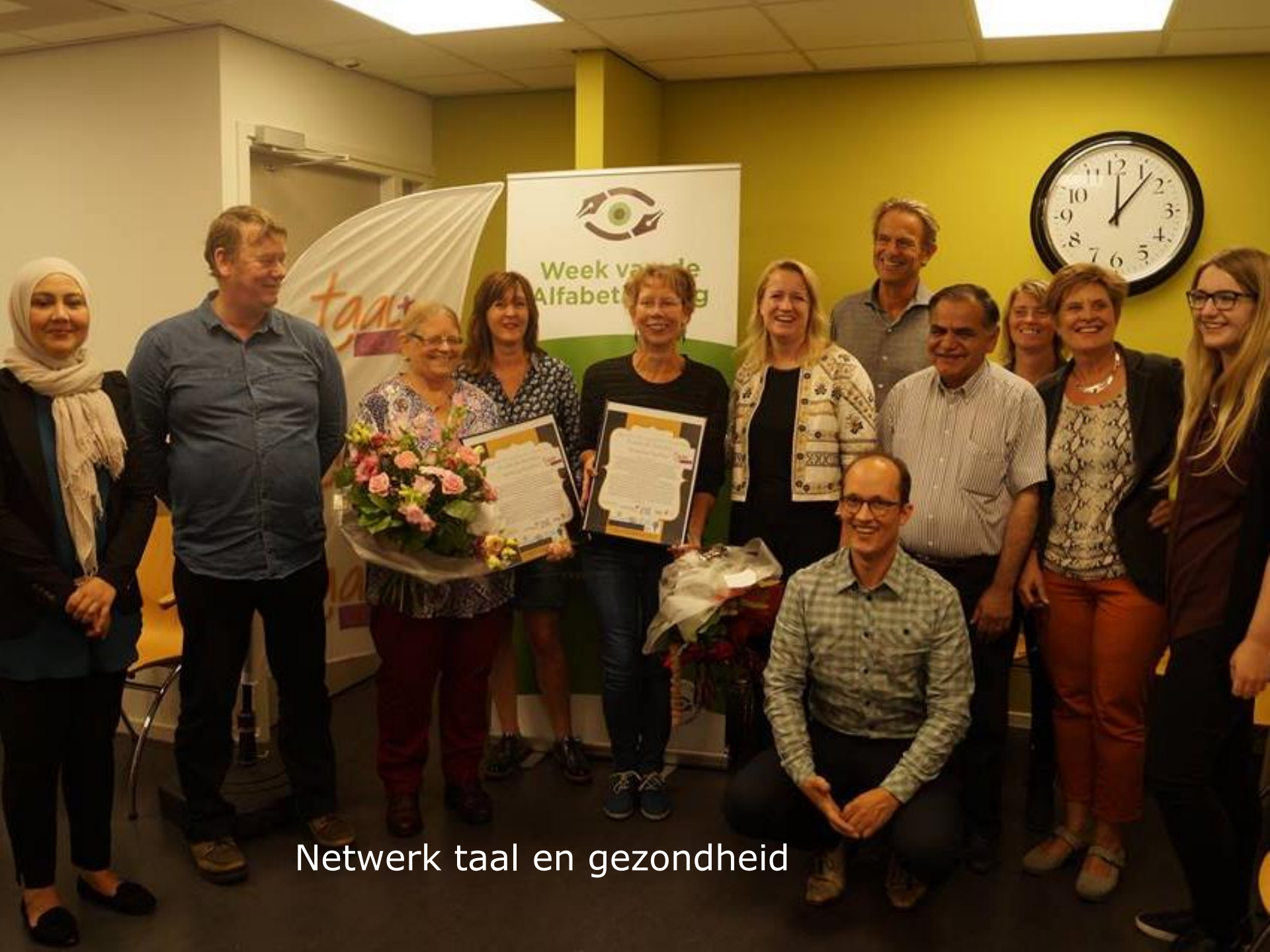
Netwerk taal en gezondheid